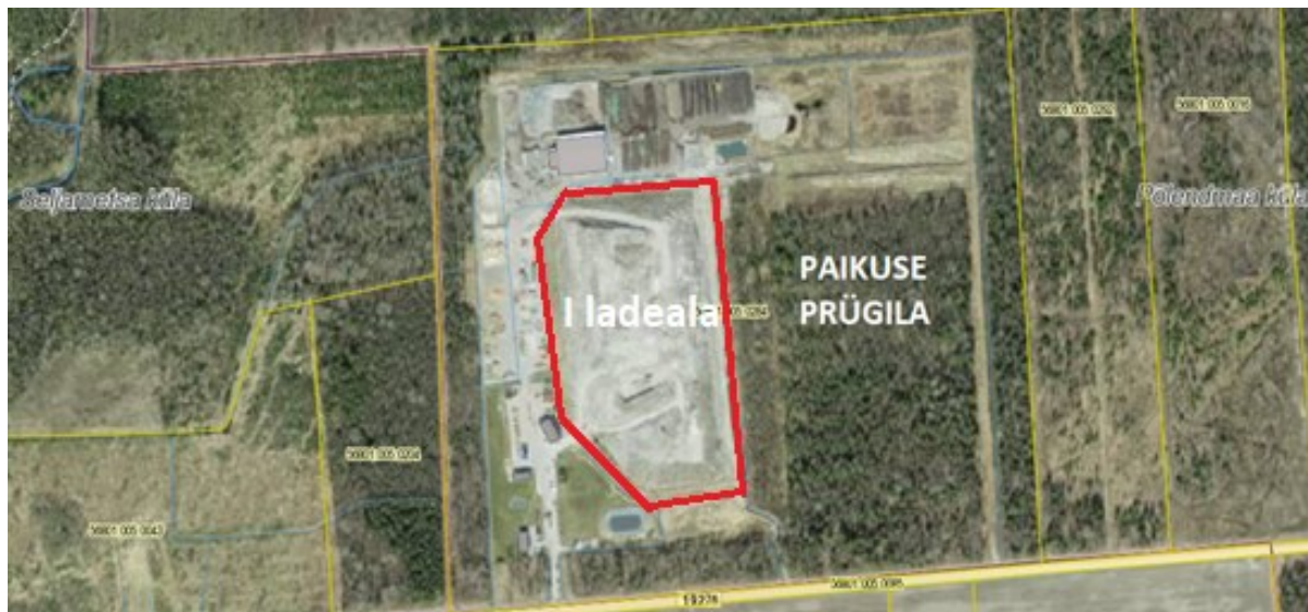
Joonis 1. Paikuse prügila I ladeala asukoht.

KMH viiakse läbi olemasoleva keskkonnakompleksloa (tegevusloa) tingimustest tulenevate otsuste tegemiseks, ehk prügila sulgemiskava koostamiseks. KMH käigus hinnatakse planeeritava tegevuse ja selle reaalsete alternatiivsete võimaluste otseseid ning kaudseid olulisi mõjusid keskkonnameetmetele, inimese tervisele, heaolule ja varale, kultuuripärandile. KMH käigus töötatakse välja keskkonnameetmed olulise keskkonnamõju vältimiseks või vähendamiseks. Keskkonnamõju hindab KMH juhtekspert ja eksperdirühm koos arendajaga.